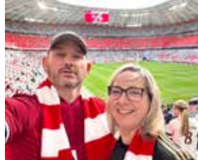
Besuch eines FC Bayern-Heimspiels mit der Freundin