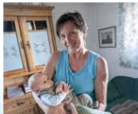
Mit dem jüngsten Familienmitglied