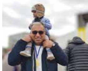
Der beste Platz der Welt - warm eingepackt und hoch hinaus.