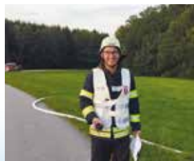
Bei der Freiwilligen Feuerwehr Zeitlarn