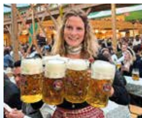
Als Bedienung auf dem Oktoberfest