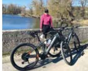
Wer rastet, der rostet