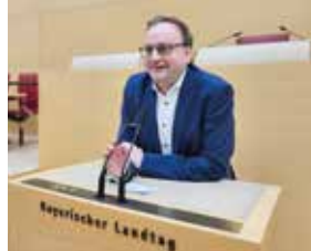
Am Rednerpult im Bayerischen Landtag