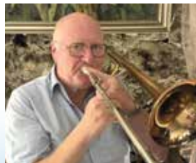
Beim Posaunespielen mit den Flickschustern