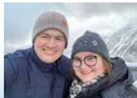
Traditioneller Winterurlaub in den Berchtesgadener Alpen.