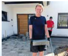
Mitanpacken beim Hausbau