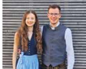
Auf dem Weg ins Vilshofener Volksfest mit meiner Freundin