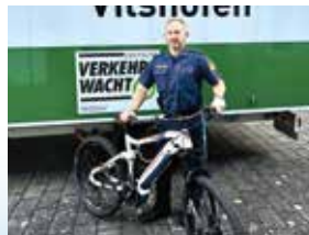
Ausübung als Verkehrserzieher, Jugendverkehrsschule