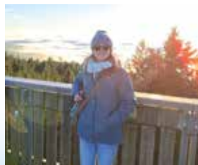
Baumwipfelpfad St. Englmar