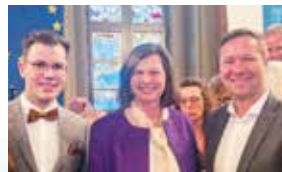
Mit Landtagspräsidentin Ilse Aigner und dem jugendpolitischen Sprecher der CSU-Landtagsfraktion beim Ehrenamts-empfang in Passau