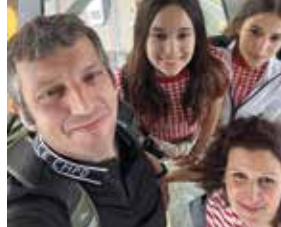
Mit der Familie hoch über der Themse