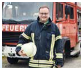
Bei der Freiwilligen Feuerwehr Albersdorf