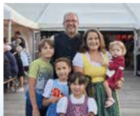
Am Vilshofener Volksfest mit der Familie