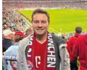
In der Allianz Arena