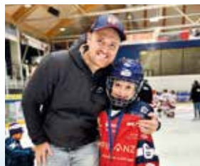
Eishockey Turnier U9 in Geretsried