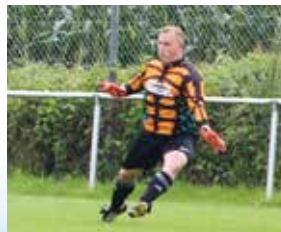
Fußball bei der SpVgg Pleinting