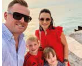
Familienurlaub am Gardasee