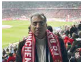
Pure Emotion im Stadion - was für ein Erlebnis!