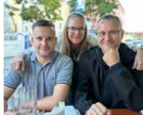
Meine Familie und ich