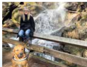
Entspannung pur: mein Hund Cooper und die Natur