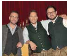
Auf der Bühne mit dem „Trio Schleudergang“