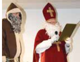
Als Nikolaus in der Montessori-Schule