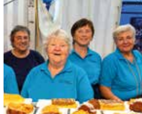
Kuchenverkauf beim Flohmarkt