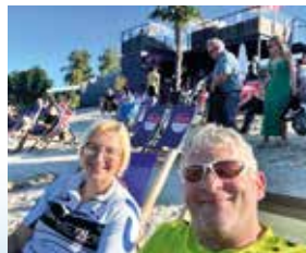
Weil Heimat mehr ist als ein Ort