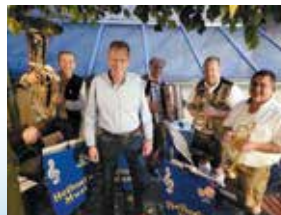
Stimmungsvoller Abend mit der Heibod'n Musi im Wolferstetter Bräustüberl